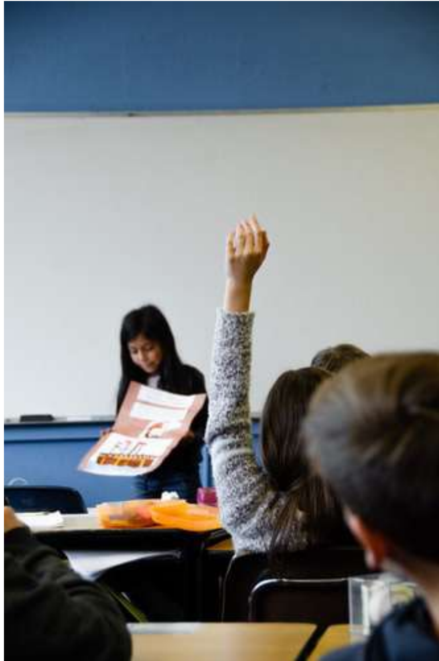
نویسنده: اعظم پیکانی