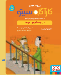
در جستجوی موها