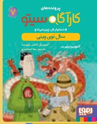
سال نوی چینی