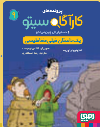
یک داستان خیلی مغناطیسی