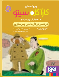
در دسر در کارخانه‌ی چترسازی