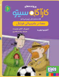
معما در جام جهانی فوتبال