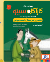
یک روز در میدان اسب‌دوانی