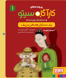
یک دستیار همه فن حریف