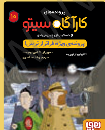
پرونده‌ی ویژه: فراتر از ترس