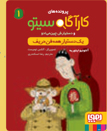
یک دستیار همه فن حریف