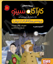
پرونده‌ی ویژه: فراتر از ترس