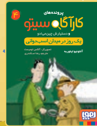
یک روز در میدان اسب‌دوانی