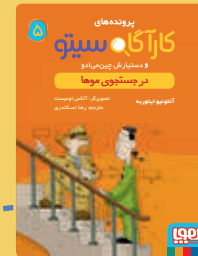
در جستجوی موها