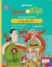
سال نوی چینی