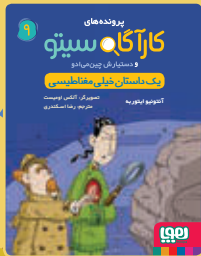
یک داستان خیلی مغناطیسی