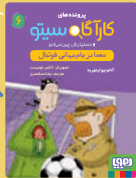
معما در جام جهانی فوتبال